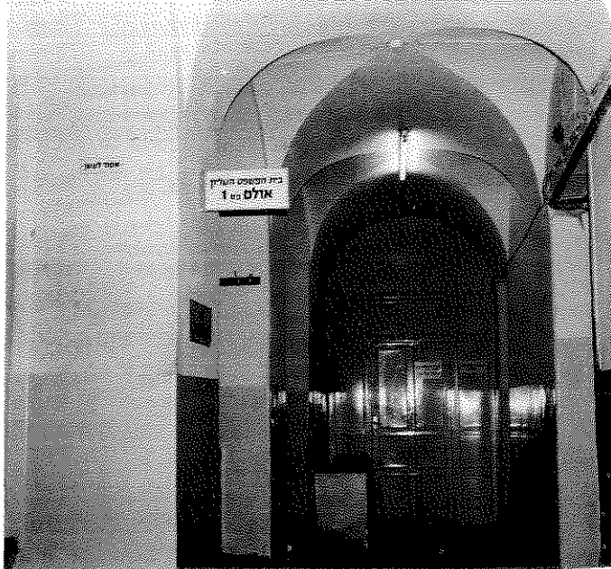
טחנת הצדק – בית המשפט העליון במשכנו הישן. החודש נחנך משכנו החדש בירושלים

אפילו אני טועה ולא תמיד כדאי הדבר בעיני עתונאי או עורך לשמור על ההגינות, האמינות והרמה המקצועית, הרי מטרת הרווח